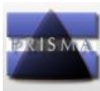
Diagram Flow PRISMA